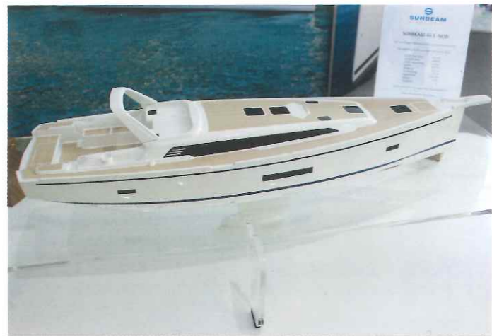
Baunummer 1 soll 2018 die Werfthallen in Österreich verlassen