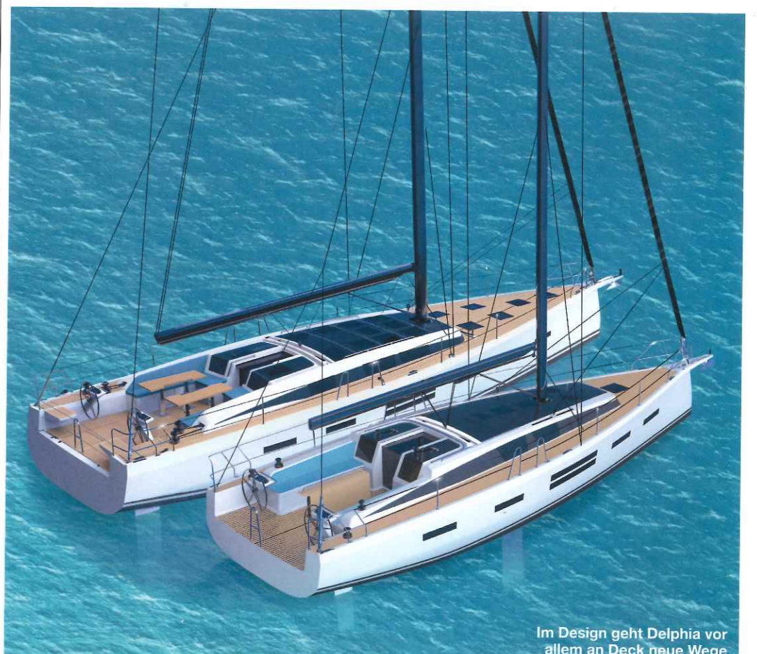
Im Design geht Delphia vor allem an Deck neue Wege