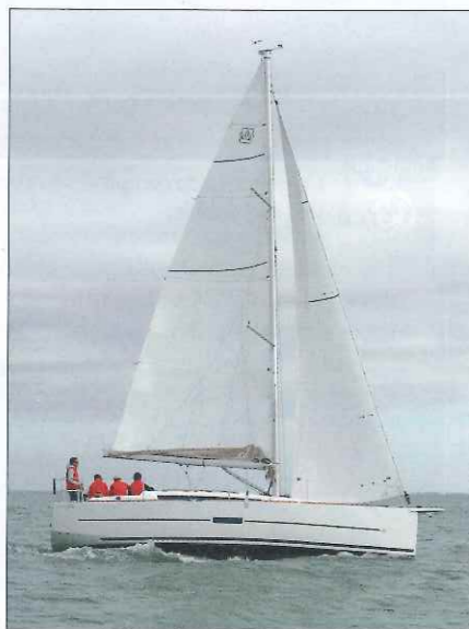
▲ Le plan de voilure équilibré avec son petit foc mérite d'être complété par un code 0.

LA FORCE de ce petit Dufour réside sans conteste dans des aménagements de qualité et dans l'incroyable déploiement d'astuces – principalement lié au travail de conception des menuiseries intérieures – qui viennent simplifier la vie en mer. Mais nous y reviendrons plus tard, le temps d'une petite mise au point portant sur la longueur du bateau. Car si la taille ne fait pas le bonheur, mieux vaut éviter les ambiguïtés. Or notre 360 GL ne fait que 34 pieds : moins de 10 m à la flottaison, presque 11 avec la delphinrière. Rien de nouveau en soi – la pratique chez Dufour n'est pas nouvelle et la concurrence gonfle elle aussi les appellations commerciales de ses unités. Nous restons cependant réservés, d'autant que le chantier devrait au contraire s'enorgueillir d'une habitabilité remarquable sur un « petit » 34 pieds ! Passons et attachons-nous aux spécificités de ce nouveau croiseur, évolution du 350 GL (VM n°229) dont les modifications les plus évidentes touchent au rouf et à la poupe. Sur le pont, cela consiste en l'ajout d'un hublot sur le nez du rouf offrant une vue sur la route depuis le carré et d'un grand carénage supérieur dont le seul but est de dissimuler les retours de drisses, écoutes et bosses de ris