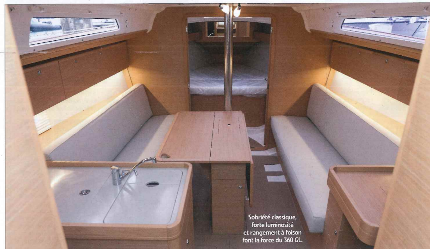
Sobriété classique, forte luminosité et rangement à foison font la force du 360 GL.

plan de voilure, s'il est cohérent pour naviguer au près, il mérite d'opter pour une voile type code 0 afin de dynamiser les bords plus abattus. La présence d'une delphinrière de série intégrant le davier et dotée d'un point d'amure va clairement dans ce sens. Classique, le Dufour l'est aussi par son design intérieur lumineux grâce au nouveau hublot frontal et bourré d'astuces qui ont l'avantage d'être ici toutes réunies. Evoquons pêle-mêle la cave à vin, les huit équipets ceinturant le carré, le tiroir et le mini-bar logés dans le meuble de la table, le carré transformable, le siège du barreur inclinable, les ramasse-miettes (dans la table et le plancher), les dessous-de-plat et planche à découper intégrés dans la cuisine et les très nombreux petits rangements qui ne laissent aucun recoin inexploité. Reste, sur notre version deux cabines, à appréhender le mode d'emploi de la grande cabine arrière dont l'immense matelas (2 x 1,80 m) est transpercé par le tube de jaumière. Deux options : faire fi de ce « poteau » au milieu du lit et dormir de part et d'autre ; ou mettre en place la demi-cloison qui permet d'isoler un tiers du lit pour en faire un rangement supplémentaire. Quand on voit dit que ce Dufour-là est bourré d'astuces ! Texte : Damien Bidaine.